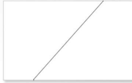
2. Modèle à deux vantaux en diagonale