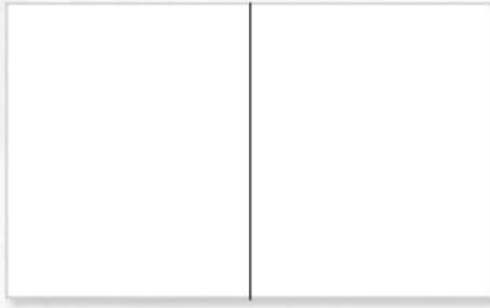
1. Modèle simple à deux vantaux